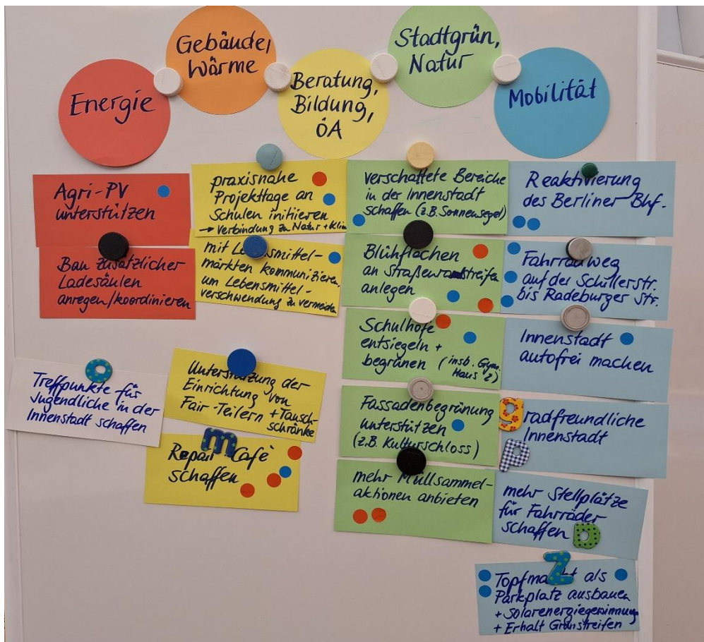
Abbildung 2: Ergebnisse vom Workshop 2 (ab 17 Jahre)