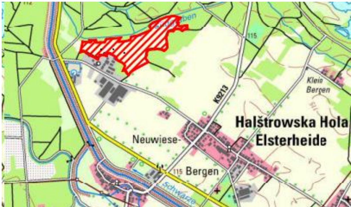
Abbildung 1 Einordnung des Vorhabens (rot umrandet) im Gemeindegebiet Neuwiese/Bergen

Die Lage und Abgrenzung des Plangebietes ist im Kartenausschnitt ersichtlich: