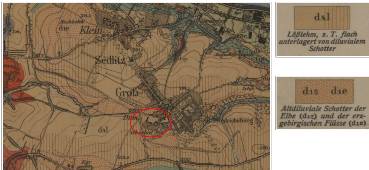
Abbildung: Auszug aus der geologischen Karte, Blatt Pirna

Ausgehend von der Vornutzung des Areals ist oberflächlich mit anthropogen beeinflussten Horizonten zu rechnen. Diese Auffüllungen können erfahrungsgemäß Mächtigkeiten bis > 2 m erreichen, da im Zuge des Rückbaus vorhandener baulicher Anlagen vermutlich auch Keller etc. verfüllt/aufgefüllt wurden.