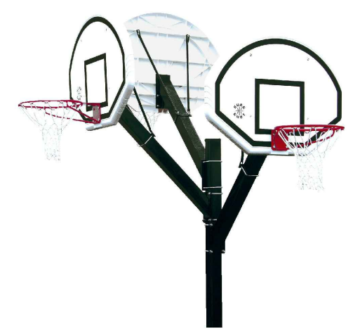
Streetballstände mit 3 höhengestaffelten Körben