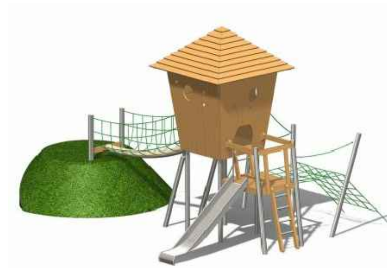
Kletterkombi Baumhaus 1