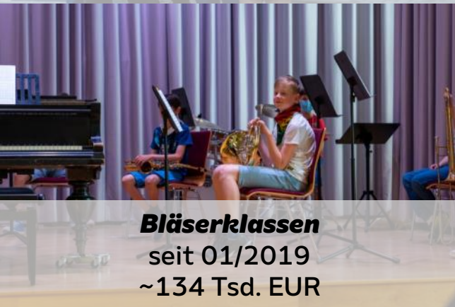
Bläserklassen seit 01/2019 ~134 Tsd. EUR