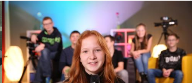
Abgedreht! – Die Stadtteilredaktion seit 06/2018 ~270 Tsd. EUR