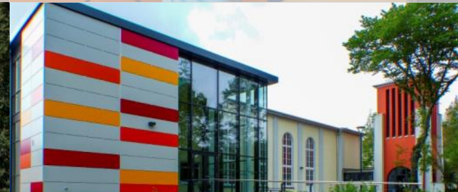
Gemeindezentrum Christuskirche seit 06/2018 ~176 Tsd. EUR