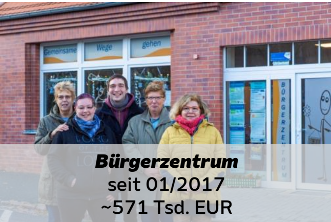
Bürgerzentrum seit 01/2017 ~571 Tsd. EUR