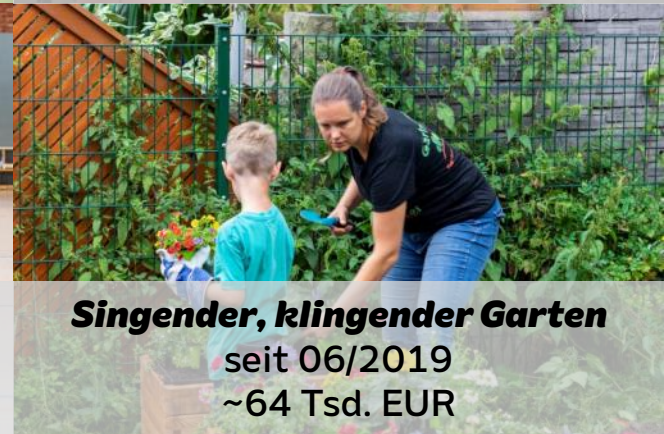
Singender, klingender Garten seit 06/2019 ~64 Tsd. EUR