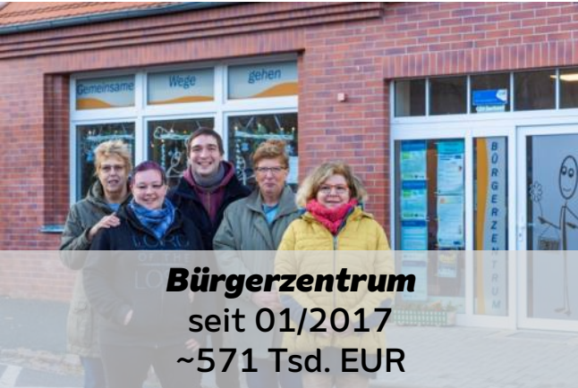
Bürgerzentrum seit 01/2017 ~571 Tsd. EUR