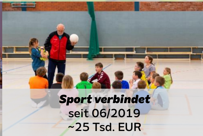
Sport verbindet seit 06/2019 ~25 Tsd. EUR