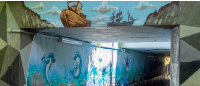
AktivKreativ seit 06/2018 ~36 Tsd. EUR