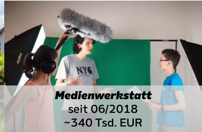
Medienwerkstatt seit 06/2018 ~340 Tsd. EUR