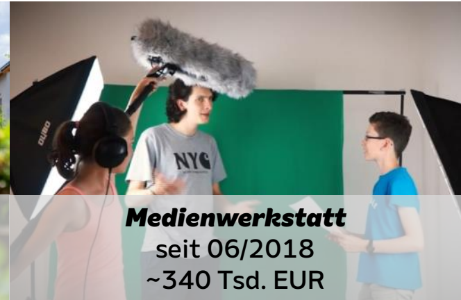
Medienwerkstatt seit 06/2018 ~340 Tsd. EUR