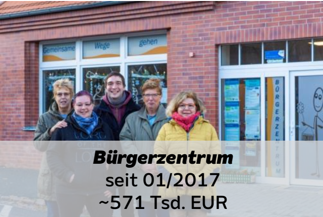
Bürgerzentrum seit 01/2017 ~571 Tsd. EUR