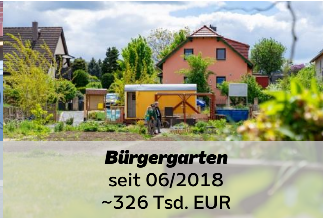
Bürgergarten seit 06/2018 ~326 Tsd. EUR