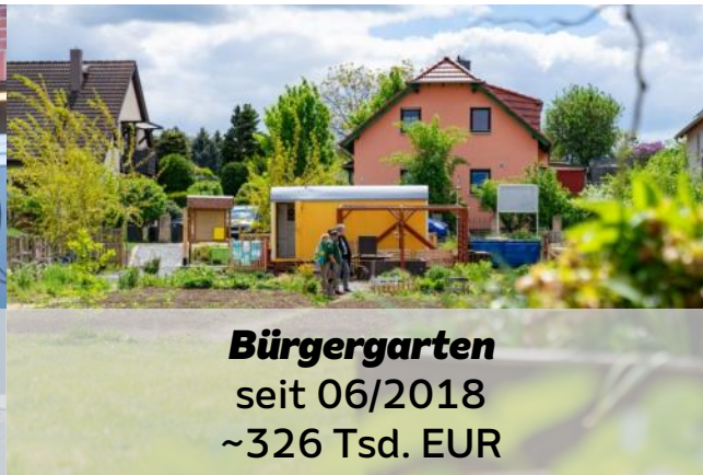
Bürgergarten seit 06/2018 ~326 Tsd. EUR