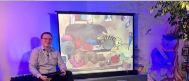
Les(e)art seit 06/2019 ~310 Tsd. EUR