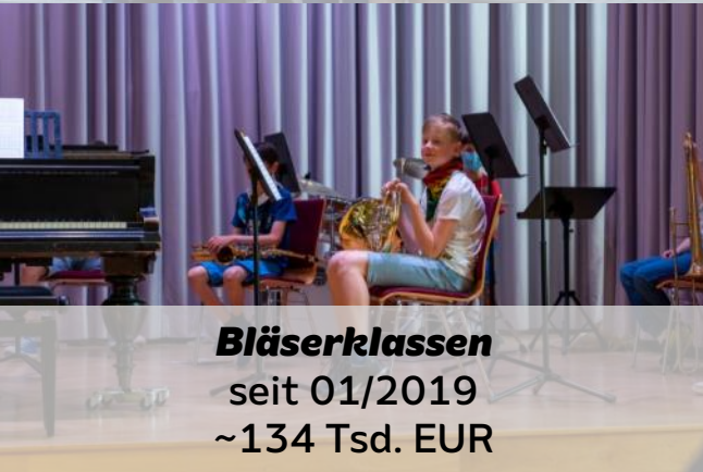
Bläserklassen seit 01/2019 ~134 Tsd. EUR