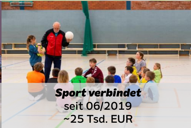
Sport verbindet seit 06/2019 ~25 Tsd. EUR