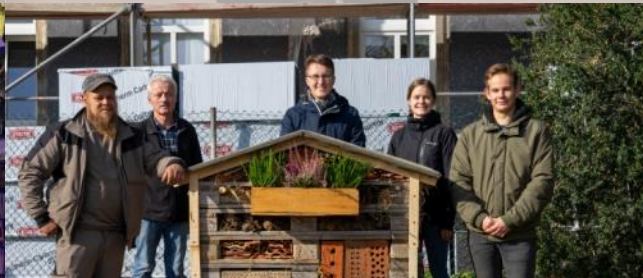
Oasen geben – Quartier erleben seit 06/2019 ~263 Tsd. EUR