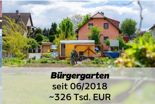
Bürgergarten seit 06/2018 ~326 Tsd. EUR