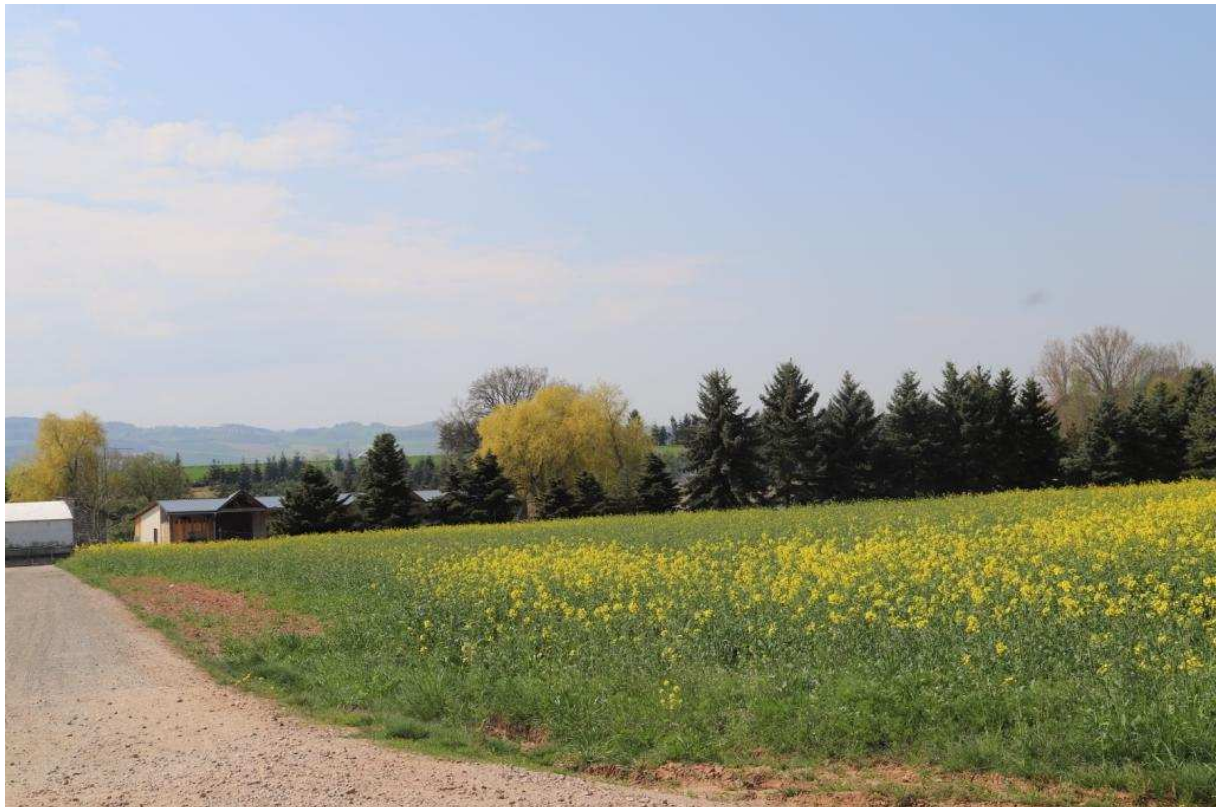
Abb. 1: Teil des Vorhabensgebietes am 02.05.2022