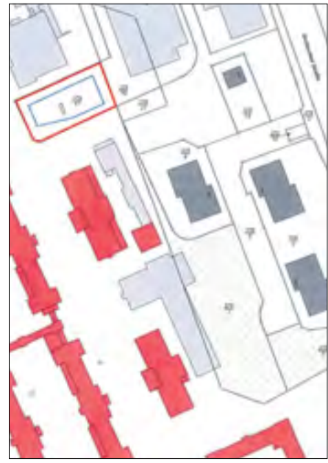
Auszug aus dem Liegenschaftskataster mit Eintragung des Baugrundstücks (mit Angabe der angrenzenden Flurstücke/Grundstücke einschließlich der Flurstücksnummern)

Rechtsbehelfsbelehrung: Gegen diesen Bescheid kann innerhalb eines Monats nach Bekanntgabe schriftlich oder zur Niederschrift bei der Stadt Leipzig, Amt für Bauordnung und Denkmalpflege, Abt. Zentrum/Sonderbauten, SG Sonderbauten; Martin-Luther-Ring 4-6, 04109 Leipzig (Besucheranschrift: Prager Straße 118-122, 04317 Leipzig) Widerspruch eingelegt werden.