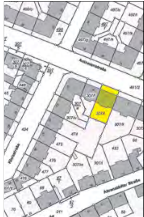
Auszug aus dem Liegenschaftskataster mit Eintragung des Baugrundstücks (mit Angabe der angrenzenden Flurstücke/Grundstücke einschließlich der Flurstücksnummern)

Rechtsbehelfsbelehrung: Gegen diesen Bescheid kann innerhalb eines Monats nach Bekanntgabe schriftlich oder zur Niederschrift bei der Stadt Leipzig, Amt für Bauordnung und Denkmalpflege, Abt. West, SG Südwest, Martin-